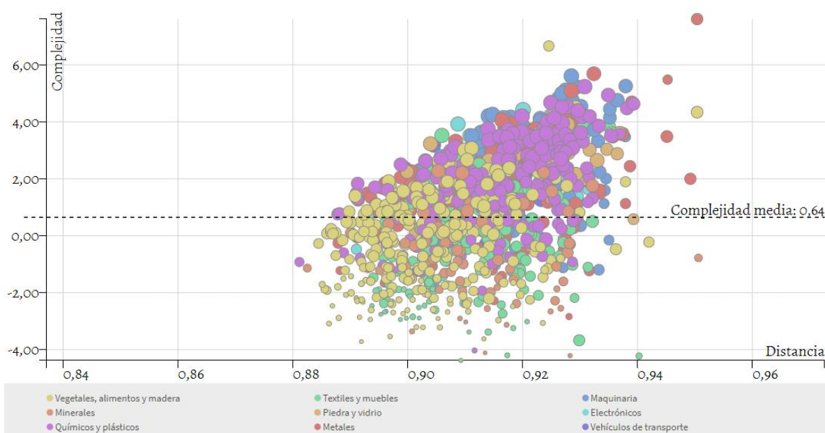
Gráfico 2. Complejidad, distancia y valor estratégico de las exportaciones.

Con el fin de realizar un ejercicio de prospectiva para el departamento, esta sección estudia productos que aún no alcanzan un nivel de exportación elevado con respecto al comercio mundial ( VCR < 1 ), pero que de ser alcanzado generaría mejoras en el nivel de complejidad del departamento. Estos productos están representados en el Gráfico 2.