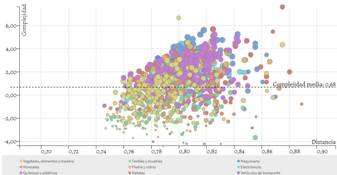
Gráfico 2. Complejidad, distancia y valor estratégico de las exportaciones.

A partir de los productos ilustrados, se tomó un subconjunto considerando los siguientes criterios: contar un VCR < 1 , exportaciones mínimo de USD 50.000, complejidad de producto mayor o igual a 0 en el caso que el departamento tenga complejidad económica negativa, o duplicar el valor de la complejidad económica del departamento si esta registra un valor positivo ( ICP > 1,36 ). Estos productos se denominan “apuestas estratégicas” y representan 217 productos.