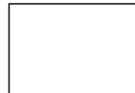
Huella Índice derecho